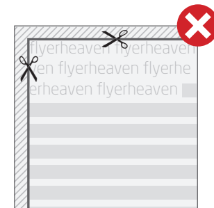
■ Fig. 2: Texte bitte immer mit einem Sicherheitsabstand zur Schneidekante anlegen. // Fig. 2: Please insert text always with a safety margin from the cutting edges.